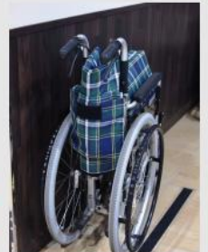
店内用車いすの貸出