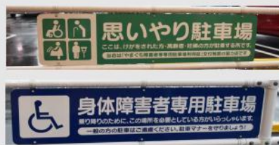
身障者用および思いやり駐車場の設置