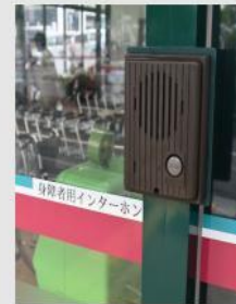
身障者用インターフォン