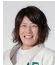
グランドスラム金メダリスト 土井雅子先生