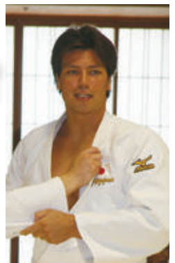
2014年、2015年 世界選手権銀メダリスト 七戸龍先生