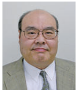
一般社団法人山口県柔道協会 会長