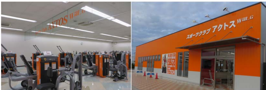
スポーツクラブ アクトス Will_G イメージ写真