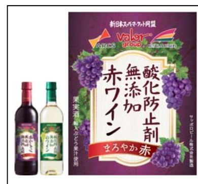
商品とラベル（新日本スーパーマーケット同盟のロゴ入）